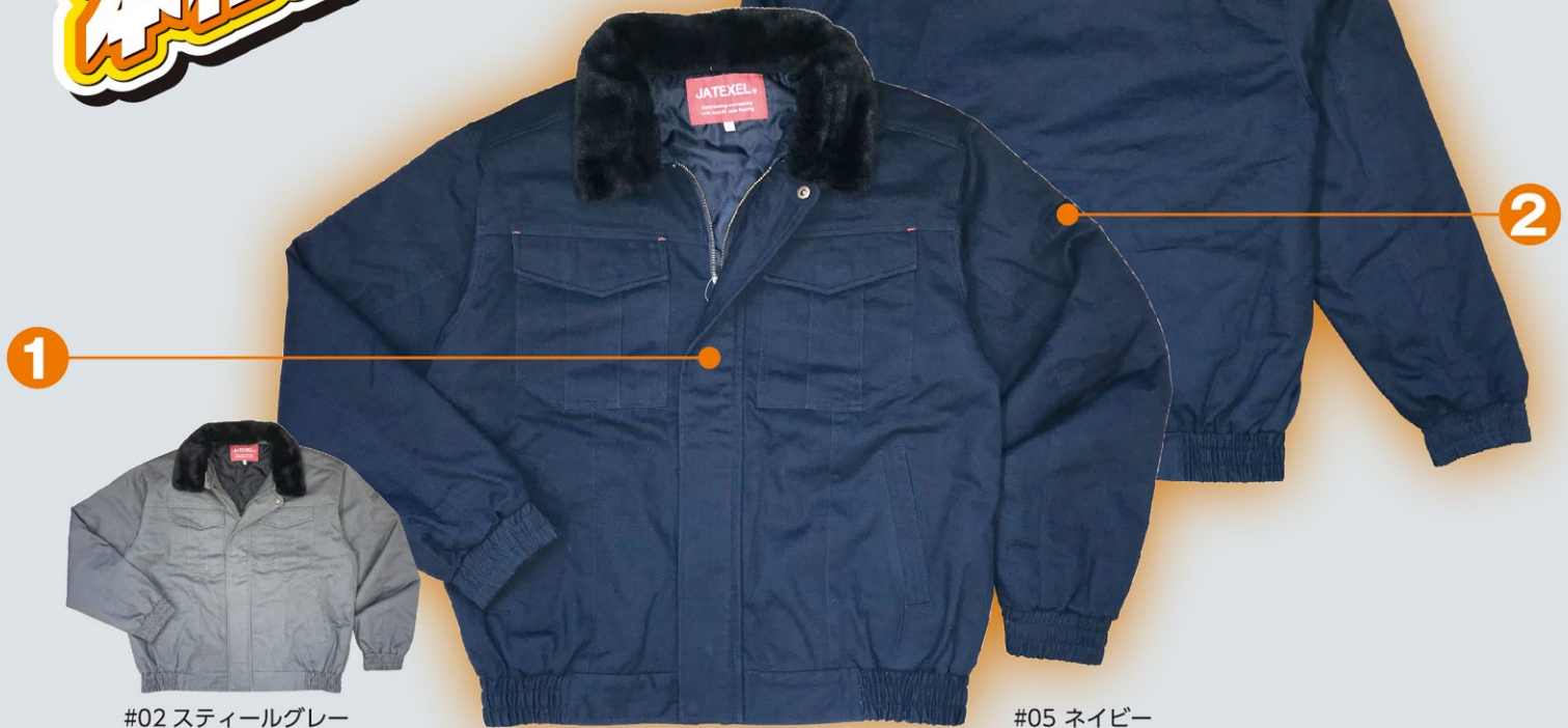
#02 スティールグレー